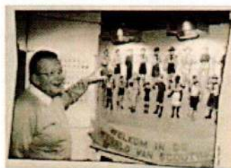
aug 1993, foto Scouting Magazine

De oorspronkelijke collectie betrof alleen de N.P.V. Die moest vanzelfsprekend worden uitgebreid met herinneringen aan de andere 3 verenigingen: de meisjes van het