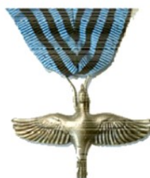
De Zilveren Vlaamse Gaai