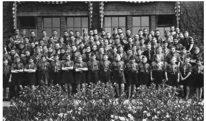
1937 Sint Jorisdag; groepsfoto van de Roothaangroep (AC) en Le Coq d'Armandville-verkenners

heeft deze logboeken in 2015 via een nicht in Nederland overgedragen aan het scouting-museum.