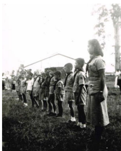
Leiding en welpen Manokwari, 1951

veel aandacht besteed aan organisatorisch zaken. In 'De Verkenner' domineert het stimuleren van de pioniers-geest, vooral in relatie tot de in 1959 op Nieuw Guinea gehouden expeditie naar het Sterrengebergte. Bij de berichtgeving in de padvindstersbladen lijkt in 'De Padvindster' vooral het eigen karakter van het scoutingspel in de tropen centraal te staan. Bij de 'Witte Margriet' ligt iets meer accent op de financiële en andere hulpverlening aan de scoutingzusters in Nieuw Guinea en de onderlinge contacten.