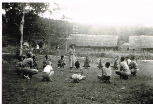
Orderoep Manokwari: wij doen ons best, 1951 NG

De sterke groei van de verkenners op Nieuw Guinea is vooral bevorderd omdat de scouting werd gestimuleerd door de protestantse zending en de in 1956 zelfstandig geworden Evangelisch Christelijke Kerk. De meeste groepen ontstonden rond door de zending opgezette internaten in de grotere plaatsen waar de Papoea's een schoolopleiding kregen. Deze scoutinggroepen werden bewust als open groep gepresenteerd.