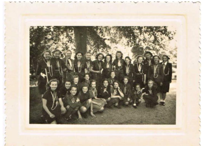
NPG groep 3 Bussum

Verder twee fotoalbums van de St. Dominicusgroep uit Nijmegen uit de periode 1946-1949 en twee logboeken van NPG groep 3 uit Bussum uit de periode 1936-1946.