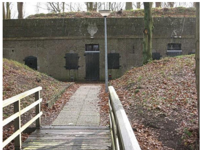
Westelijk fort vesting Naarden: Hamerfort, genoemd naar de Mgr. Hamergroep die hier haar onderkomen had tot 1968.

In de naoorlogse periode zijn enkele grote tochten ondernomen. In 1952, 1953 en 1955 ging men met Pinksteren samen met voortrekkers van andere groepen per bus naar Echtenach (Luxemburg). In 1954 maakte de stam op de fiets een tocht langs de Rijn bij Keulen en omgeving. Van de overige onderwerpen noem ik de volgende. Uitvoerig wordt de renovatie en de inrichting van de stamhut beschreven.