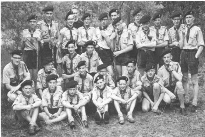
De verkenners van de Mgr. Hamergroep in augustus 1962.

In het Nationaal Scoutingmuseum bevinden zich zes logboeken van de mgr. Hamergroep. Dit betreft één logboek van welpenhorde I van 1 oktober 1960 tot 19 november 1966. Verkennersgroep I is vertegenwoordigd met twee logboeken respectievelijk van 13 juni 1945 tot 14 augustus 1947 en van 24 september 1947 tot 22 januari 1949. Van Verkennersgroep II is één logboek aanwezig. Dit heeft betrekking op de periode van 30 juli 1946 tot 12 augustus 1948. Verder is er een logboek van de Troepraad over de periode 16 oktober 1960 tot 19 november 1966.