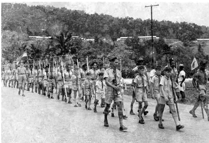
Wandelmarsen Hollandia Nieuw Guinea ca. 1956

Tot deze conclusie komt Hans van Spanning in een door hem verricht bronnen- en literatuuronderzoek over de scouting op Nederlands Nieuw Guinea in de jaren 1950-1962. In deze studie richt hij zich op twee thema's. Welk beleid werd gevoerd ten aanzien van de scouting op Nieuw Guinea en welke aandacht kreeg de scouting op Nieuw Guinea in Nederland?