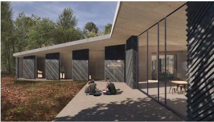
Impressie van het nieuwe Blauwe Vogelhuis

Het oude Blauwe Vogelhuis op Scoutcentrum Buitenzorg heeft bijna 60 jaar onderdak geboden aan grote groepskampen en was een centraal gelegen trainingslocatie voor kaderleden van Scouting Nederland. Het is destijds ingericht voor scouts met een lichamelijke beperking. De naam verwijst naar het sprookje van Mytyl en Tytyl en de Blauwe Vogel die geluk brengt en inspiratie is van de Bijzondere Eisen (BE) speltak van Scouting Nederland. Maar het gebouw is na al die jaren dringend aan vervanging toe. In het voorjaar van 2024 wordt gestart, op dezelfde plek, met de bouw van een nieuwe groepsaccommodatie.